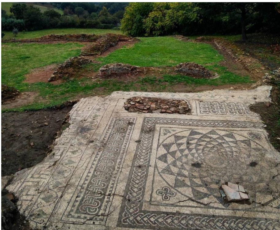
Parco archeologico di Aeclanum, pavimentazione musiva