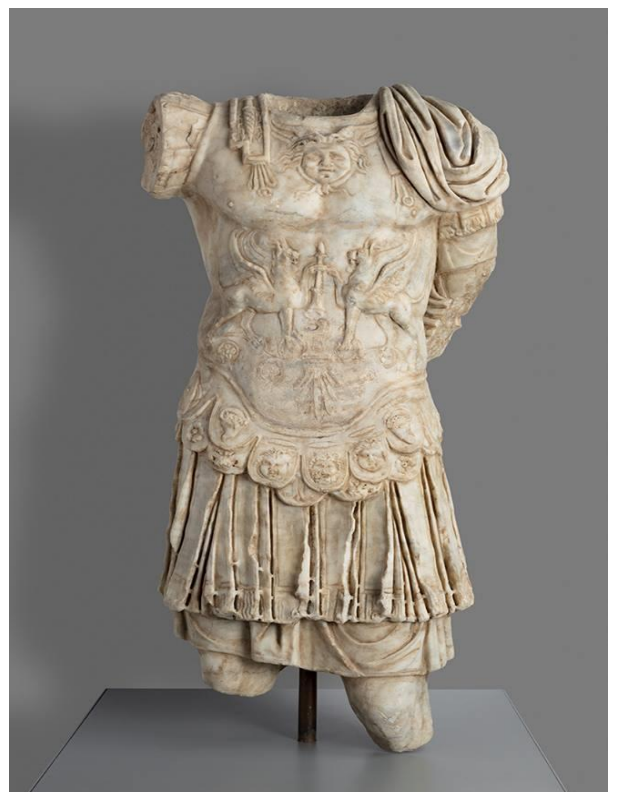
Busto acefalo di Marco Aurelio, Aeclanum (I – II secolo d.C.)

http://www.borgodicastelvete.it/il_borgo.php