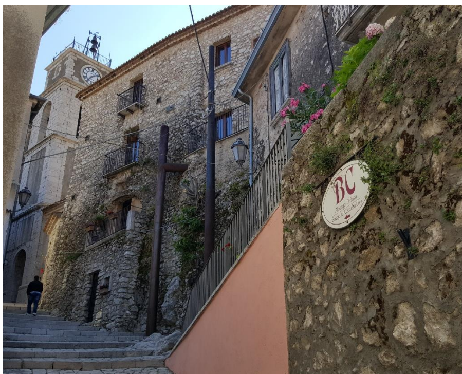
L'albergo diffuso di Castelvete sul Calore (Avellino)