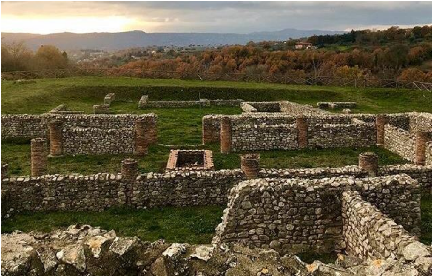
Parco archeologico di Aeclanum, domus romana (I secolo d.C.)