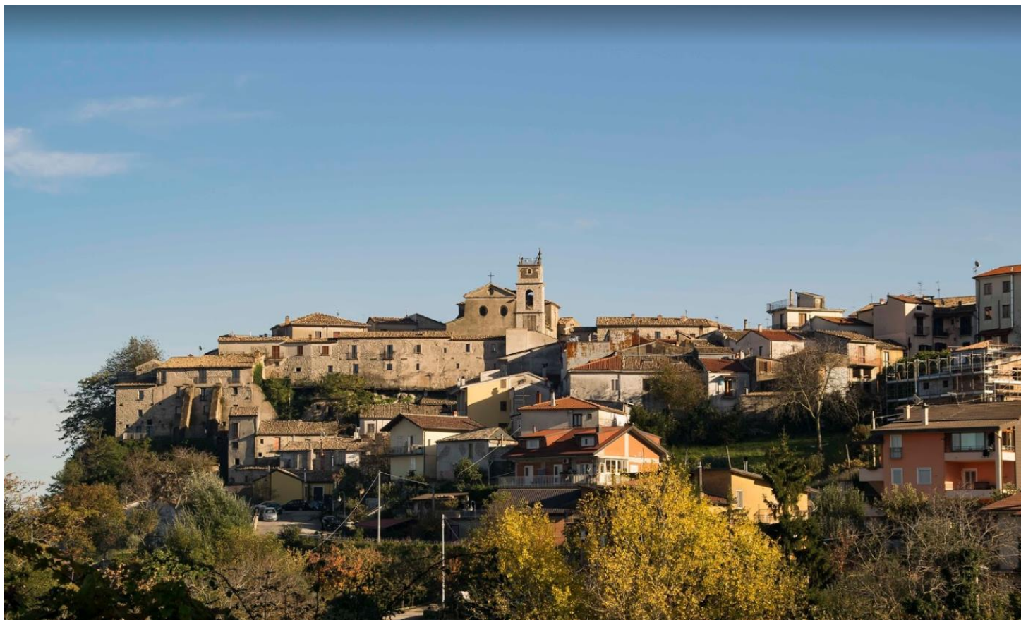
Castelvete sul Calore (Avellino)